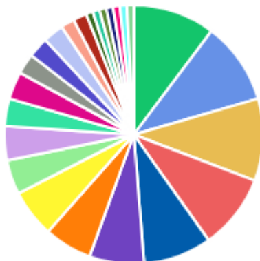
DFDs POR ÁREA DEMANDANTE